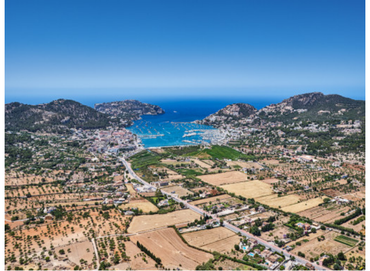
Das Anwesen aus der Vogelperspektive