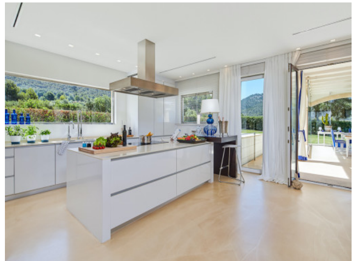
Moderne Küche mit Kochinsel