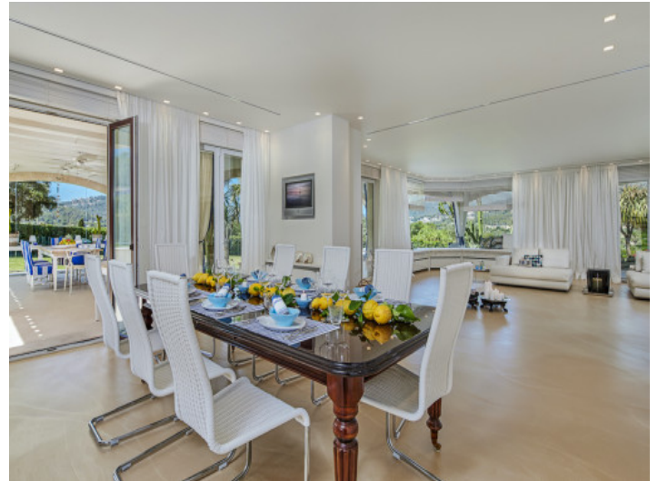
Offener Wohnbereich und Essbereich