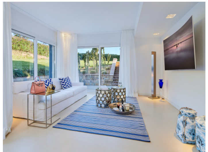
Hauptschlafzimmer mit Badezimmer und Wohnbereich en Suite

Alle Angaben nach bestem Wissen. Irrtum und Zwischenverkauf vorbehalten. Dieses Exposé ist eine Vorinformation, als Rechtsgrundlage gilt allein der notariell abgeschlossene Kaufvertrag.