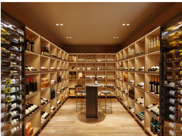
Fantastische, eigene Bodega