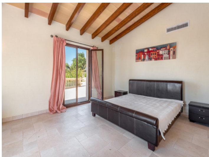
Eines von 10 Schlafzimmern