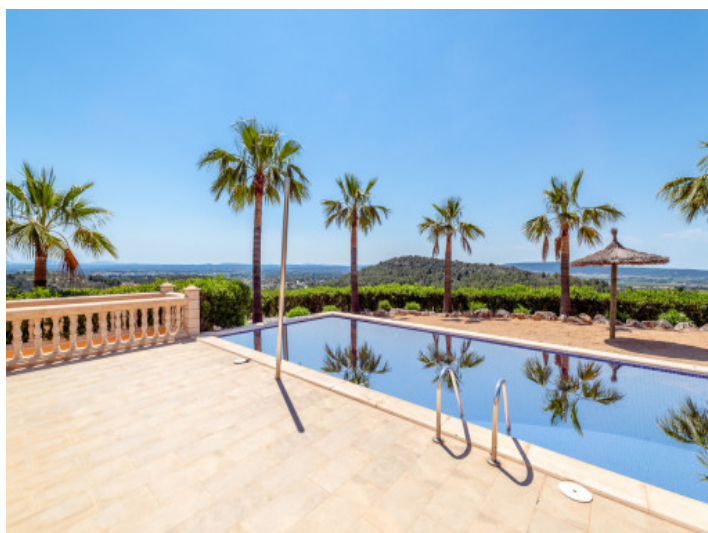
Poolbereich mit schönem Weitblick