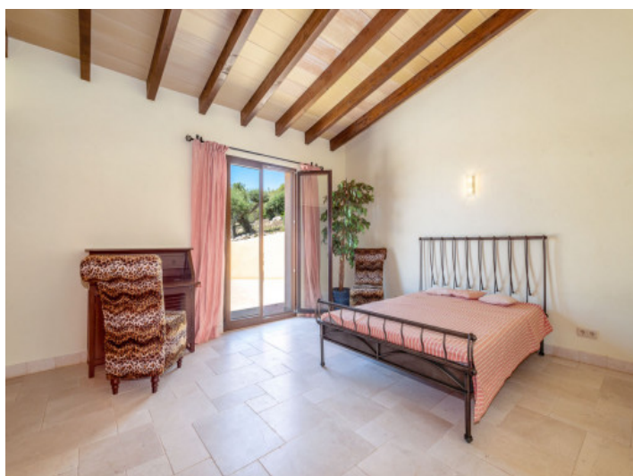
Eines von 10 Schlafzimmern