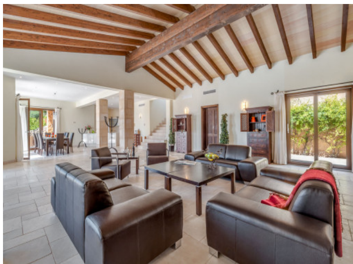
Offener Wohnbereich mit Holzdeckenbalken