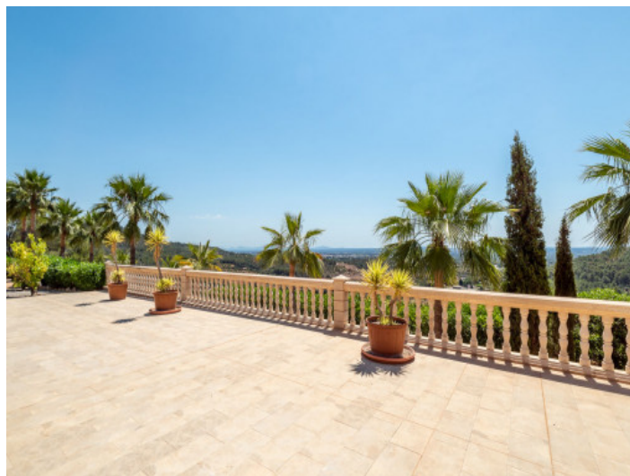
Terrasse mit Blick über die Landschaft