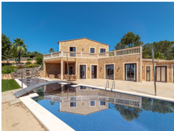
Außenansicht und Poolbereich