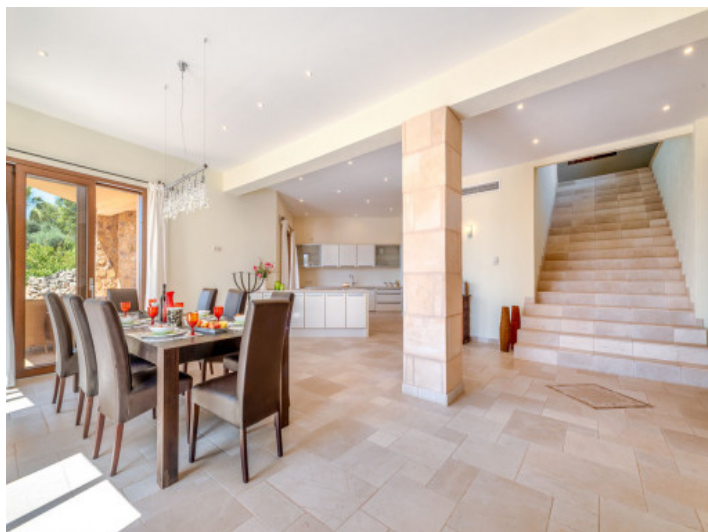
Essbereich und offene Küche