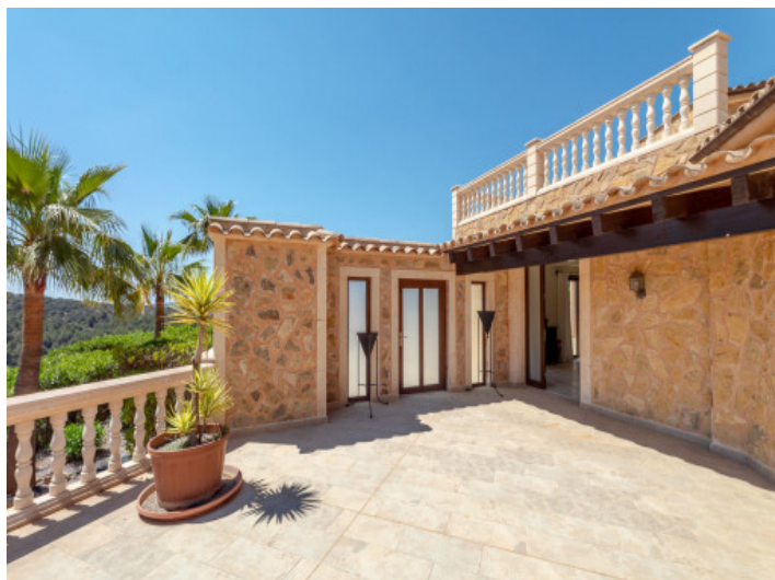
Obere, sonnige Terrasse