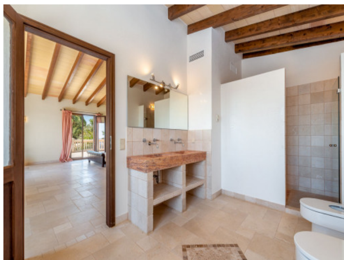
Eines von 6 Badezimmern