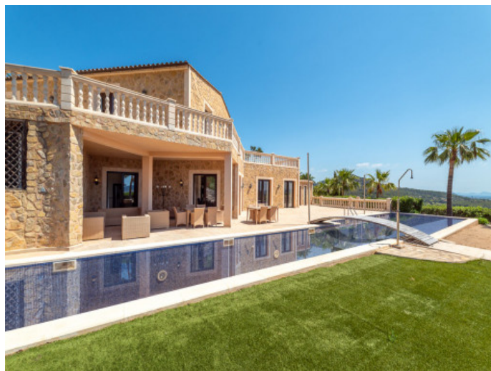
Langer 24 Meter Pool