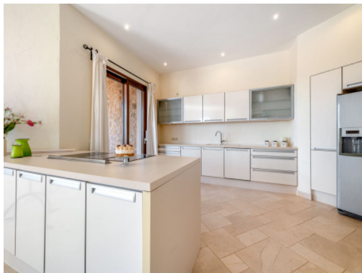
Große, moderne Küche