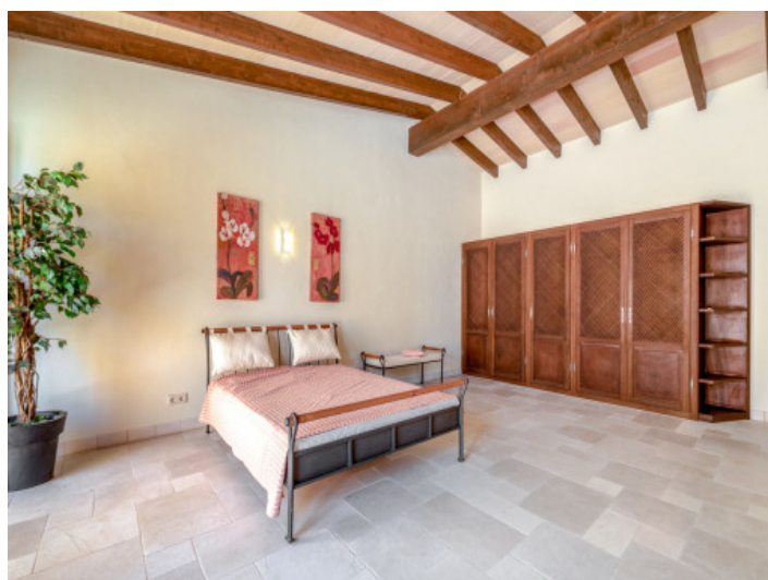
Eines von 10 Schlafzimmern

Alle Angaben nach bestem Wissen. Irrtum und Zwischenverkauf vorbehalten. Dieses Exposé ist eine Vorinformation, als Rechtsgrundlage gilt allein der notariell abgeschlossene Kaufvertrag.