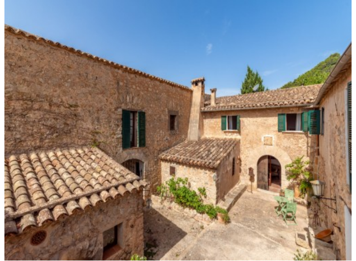
Herrlicher, typisch mallorquinischer Innenhof