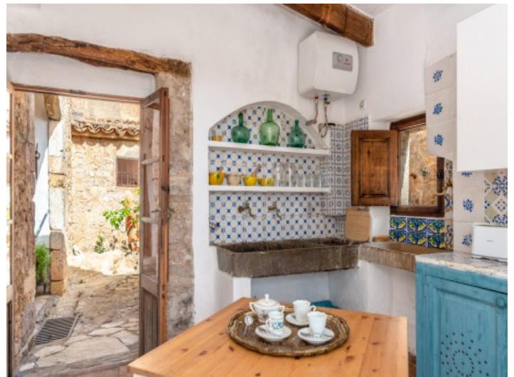
Rustikale mallorquinische Küche