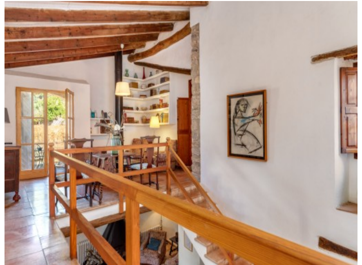
Wohnbereich auf der oberen Galerie