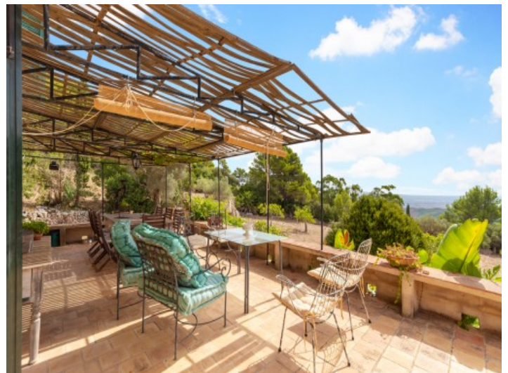
Terrasse mit tollem Weitblick

Alle Angaben nach bestem Wissen. Irrtum und Zwischenverkauf vorbehalten. Dieses Exposé ist eine Vorinformation, als Rechtsgrundlage gilt allein der notariell abgeschlossene Kaufvertrag.