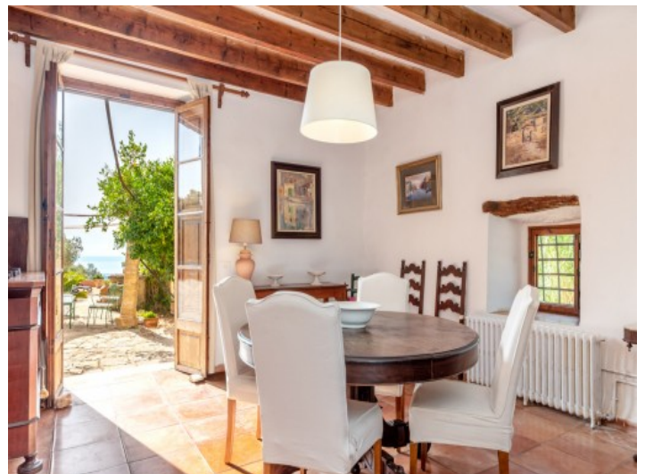
Essbereich mit Terrassenzugang

Alle Angaben nach bestem Wissen. Irrtum und Zwischenverkauf vorbehalten. Dieses Exposé ist eine Vorinformation, als Rechtsgrundlage gilt allein der notariell abgeschlossene Kaufvertrag.