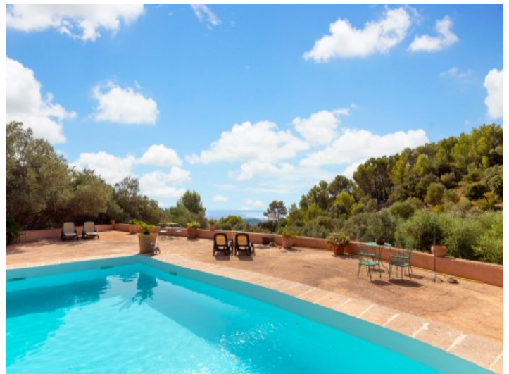
Pool in einzigartiger Lage