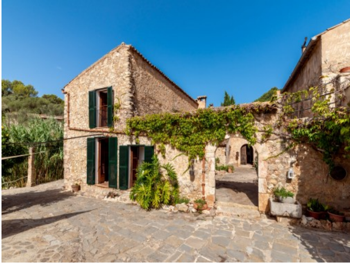
Außenansicht des authentischen Anwesens