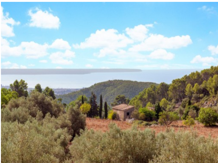
Fantastischer Panoramablick bis aufs Meer