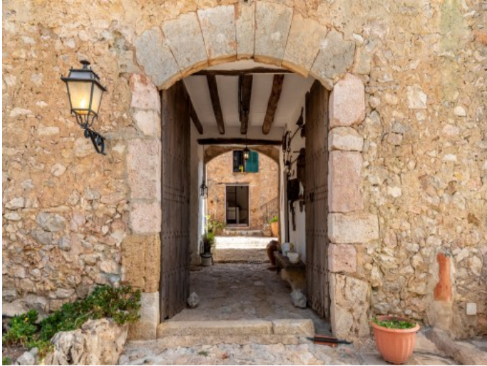
Ursprünglicher Eingang zur Finca