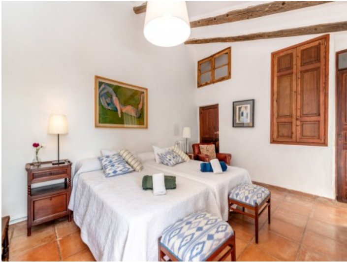
Eines von 7 Schlafzimmern