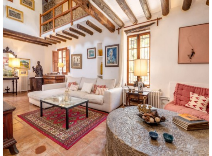
Bezaubernder Wohnbereich mit Holzbalkendecke