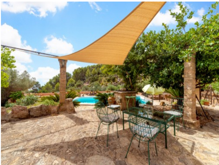
Idyllische Terrasse neben dem Pool