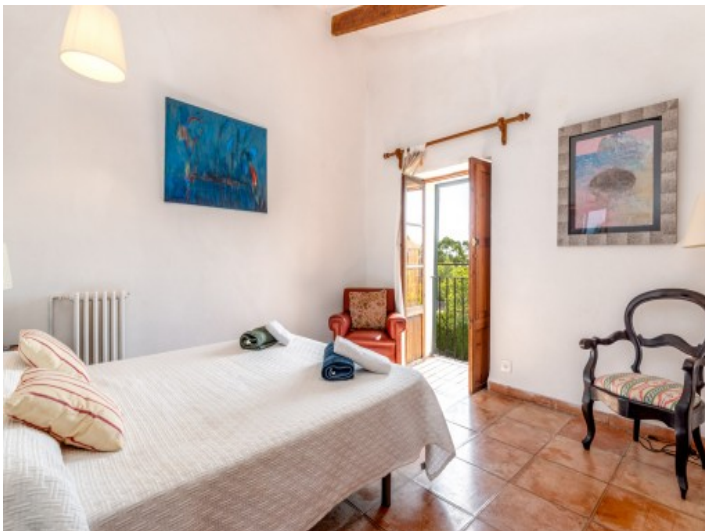
Eines von 7 Schlafzimmern