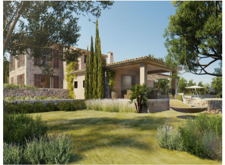
Außenansicht und Garten

Alle Angaben nach bestem Wissen. Irrtum und Zwischenverkauf vorbehalten. Dieses Exposé ist eine Vorinformation, als Rechtsgrundlage gilt allein der notariell abgeschlossene Kaufvertrag.