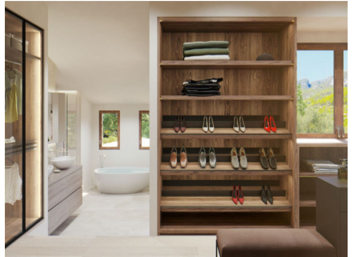
Ankleidebereich und Badezimmer en Suite