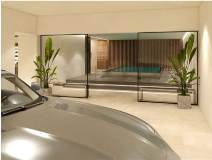
Garage und Spabereich