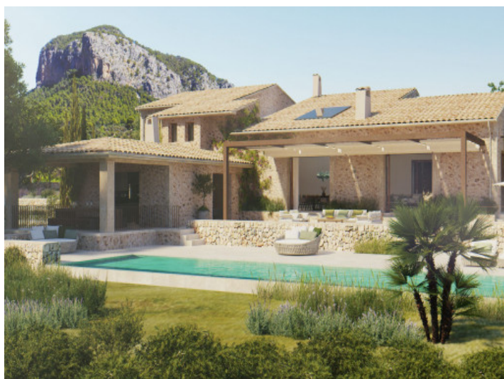
Außenansicht der Finca