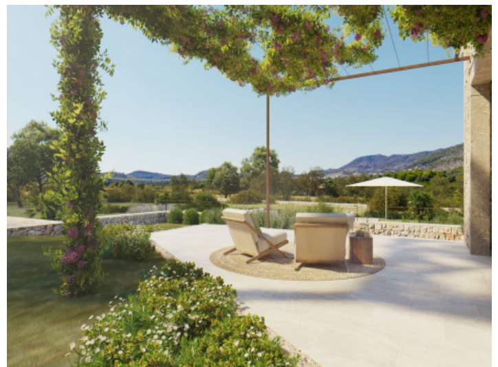
Sitzbereich auf der Terrasse