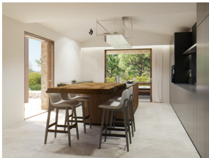
Essbereich in der Küche

Alle Angaben nach bestem Wissen. Irrtum und Zwischenverkauf vorbehalten. Dieses Exposé ist eine Vorinformation, als Rechtsgrundlage gilt allein der notariell abgeschlossene Kaufvertrag.