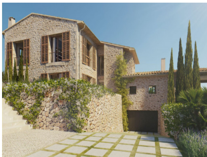
Außenansicht der Finca mit Garage