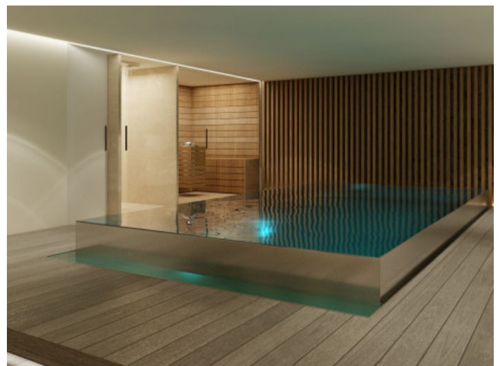
Innenpool im untersten Stockwerk

Alle Angaben nach bestem Wissen. Irrtum und Zwischenverkauf vorbehalten. Dieses Exposé ist eine Vorinformation, als Rechtsgrundlage gilt allein der notariell abgeschlossene Kaufvertrag.