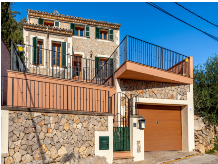
Zufahrt zur Garage der Villa

Superficie útil: 207,05 m 2 Superficie construida: 244,31 m 2 0 1 2 4m