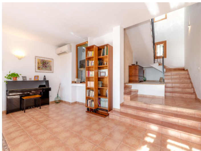
Wohnbereich und Flur

Alle Angaben nach bestem Wissen. Irrtum und Zwischenverkauf vorbehalten. Dieses Exposé ist eine Vorinformation, als Rechtsgrundlage gilt allein der notariell abgeschlossene Kaufvertrag.