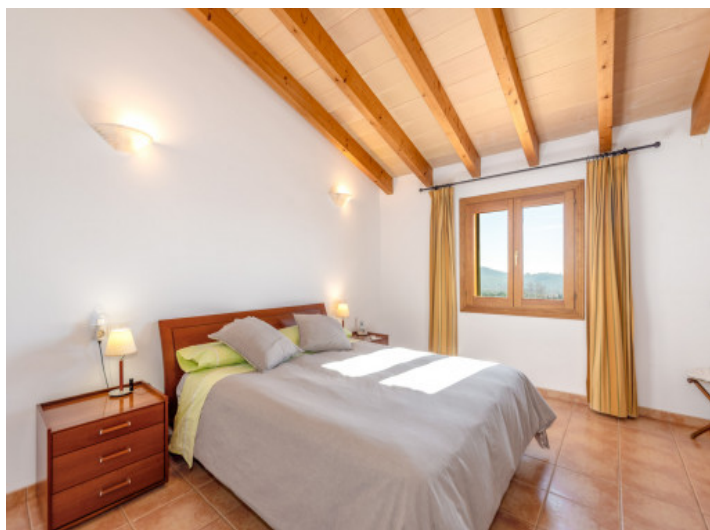
Alternative Ansicht des Schlafzimmers