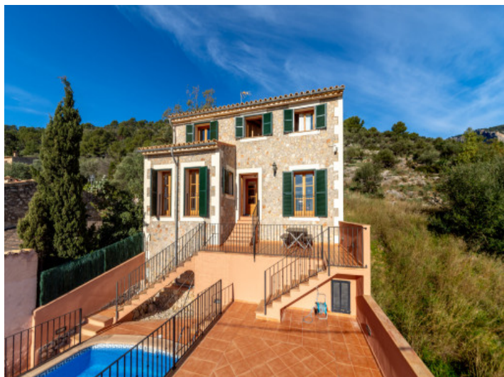
Villa auf großem Grundstück mit Pool in Alaró