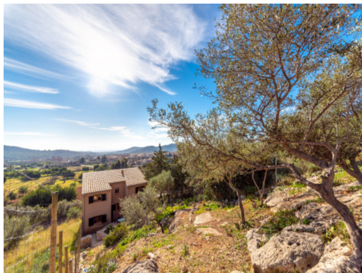
Blick vom Garten runter zum Haus