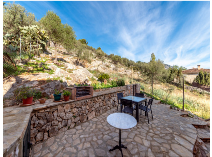
Terrasse und Grillbereich