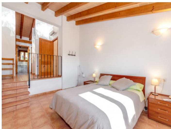
Schlafzimmer mit Holzbalkendecke