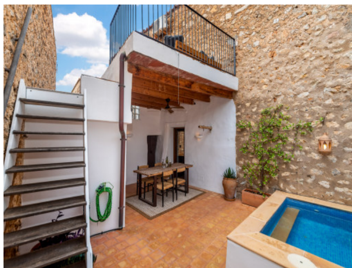
Patio mit Pool