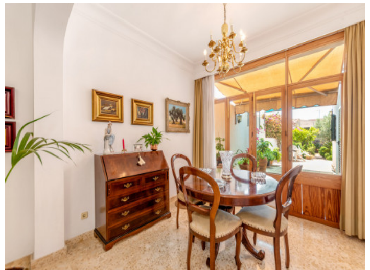
Essbereich mit Terrassenzugang

Alle Angaben nach bestem Wissen. Irrtum und Zwischenverkauf vorbehalten. Dieses Exposé ist eine Vorinformation, als Rechtsgrundlage gilt allein der notariell abgeschlossene Kaufvertrag.