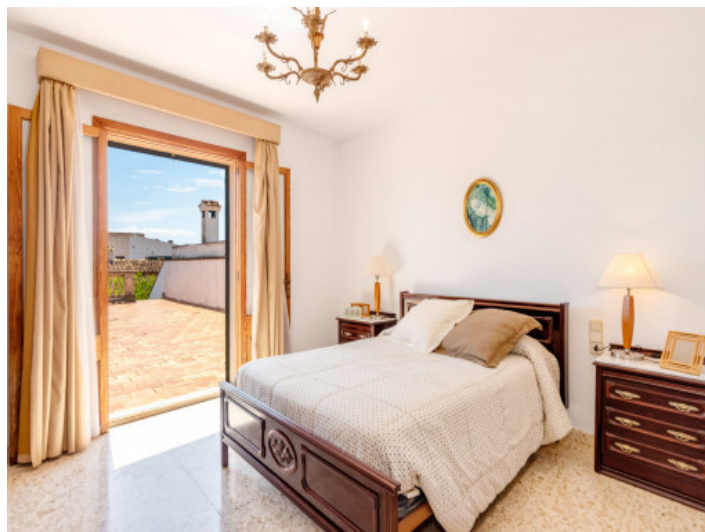
Schlafzimmer mit Dachterrasse