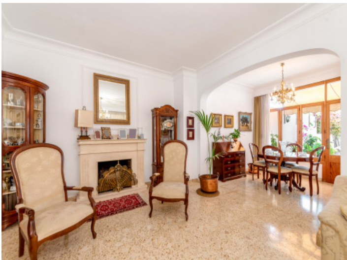
Wohn- und Essbereich