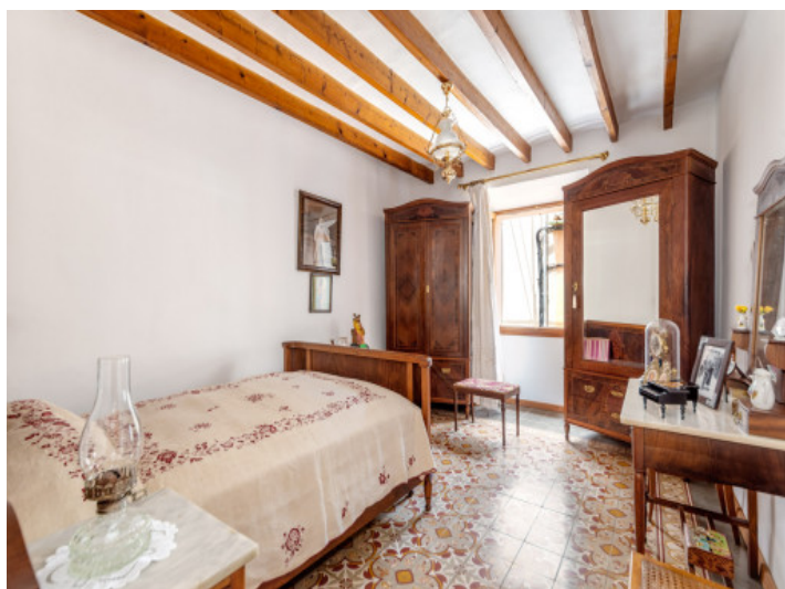
Schlafzimmer mit Dachterrasse