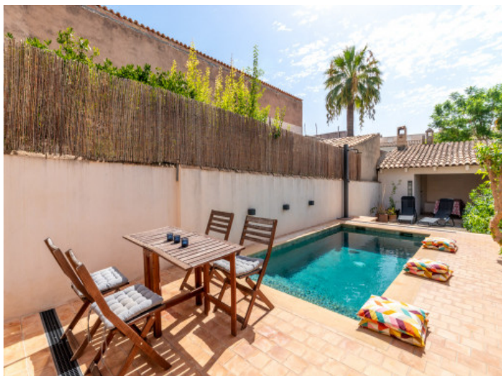
Herlicher privater Pool