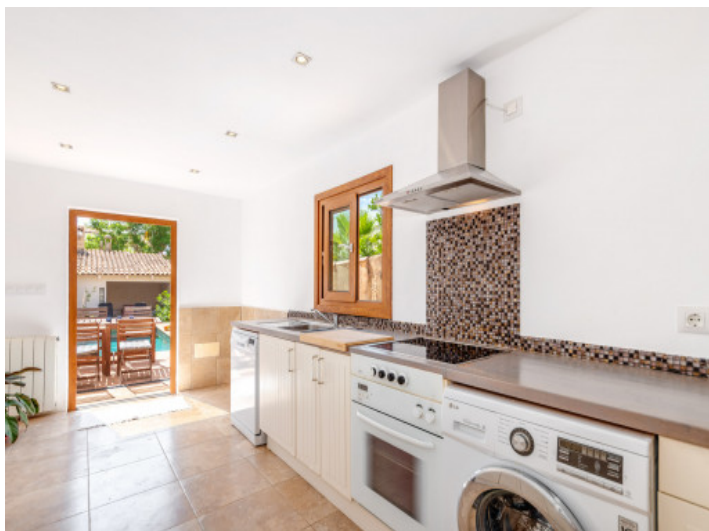
Küche mit direkten Terrassenzugang