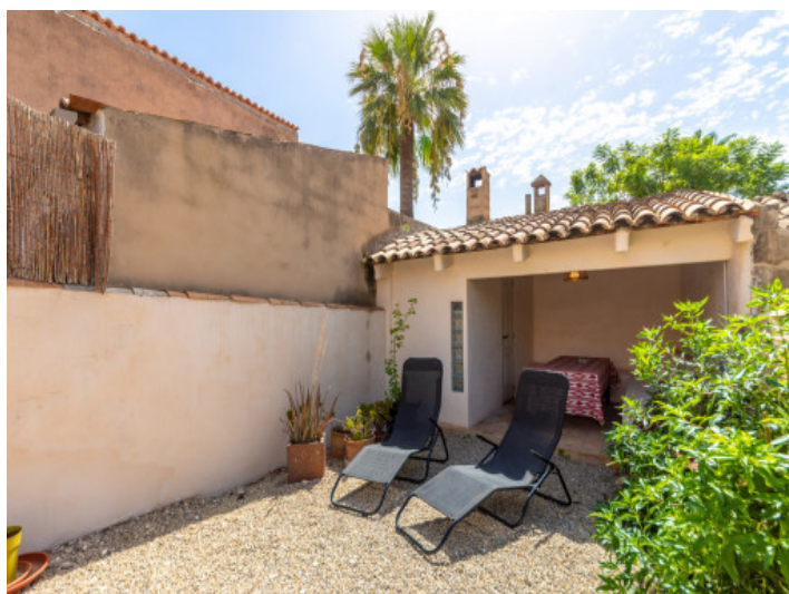
Patio mit überdachtem Essbereich