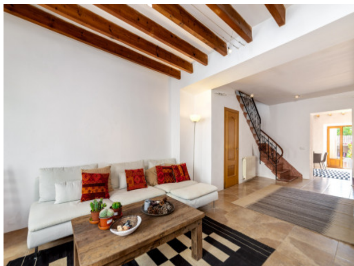
Wohnbereich mit Holzbalkendecke

Alle Angaben nach bestem Wissen. Irrtum und Zwischenverkauf vorbehalten. Dieses Exposé ist eine Vorinformation, als Rechtsgrundlage gilt allein der notariell abgeschlossene Kaufvertrag.