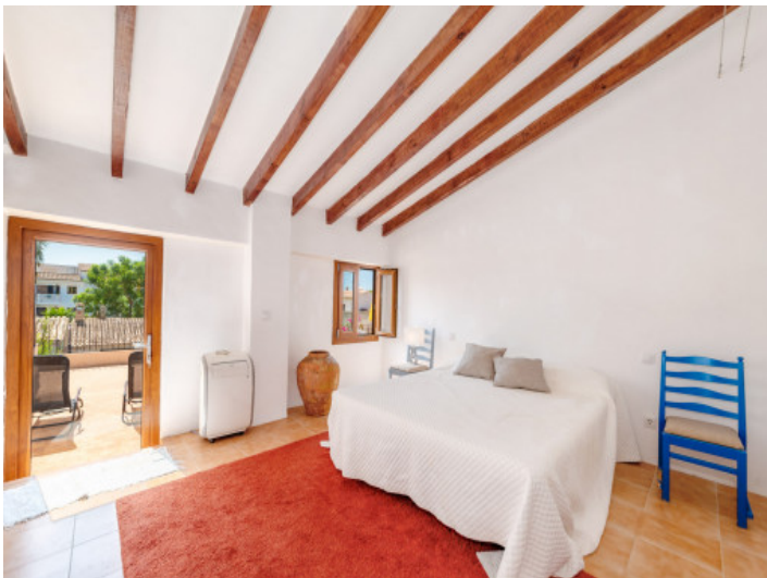
Schlafzimmer mit eigener Terrasse