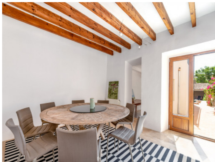
Schöner Essbereich mit Terrassenzugang