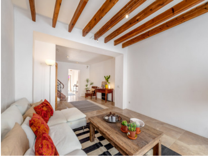
Alternative Ansicht des Wohnbereichs