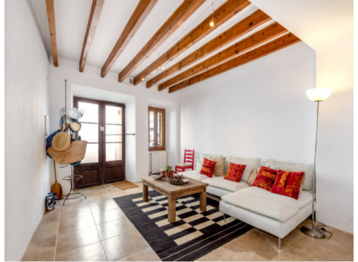
Wohnbereich und Eingang