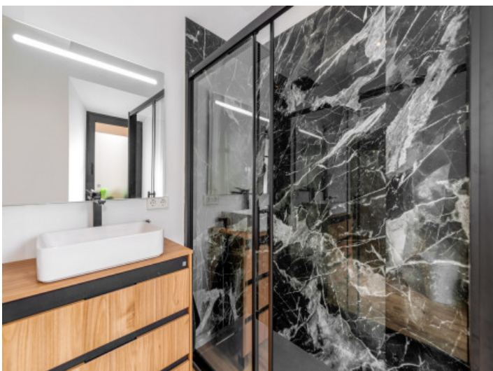
Eines von 3 Badezimmern