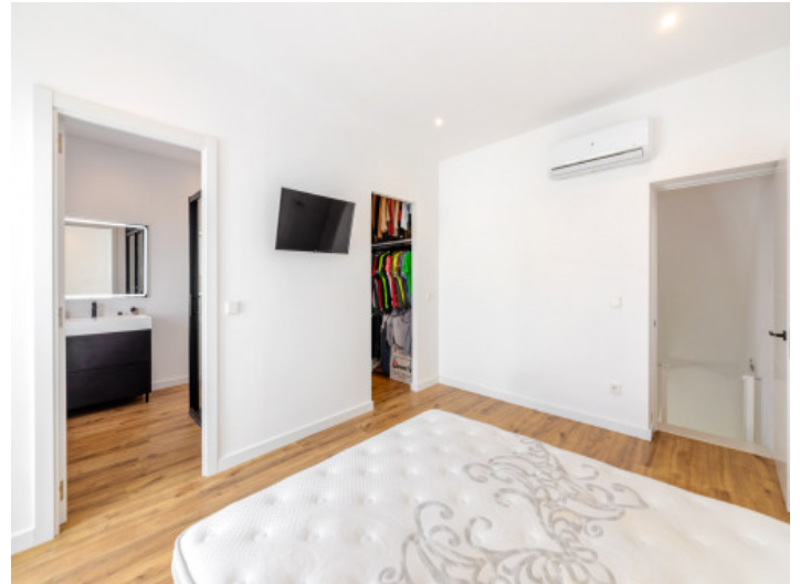
Eines von 2 Schlafzimmern