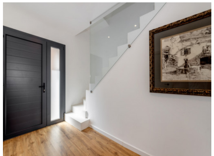
Modern gestalteter Eingangsbereich

Alle Angaben nach bestem Wissen. Irrtum und Zwischenverkauf vorbehalten. Dieses Exposé ist eine Vorinformation, als Rechtsgrundlage gilt allein der notariell abgeschlossene Kaufvertrag.