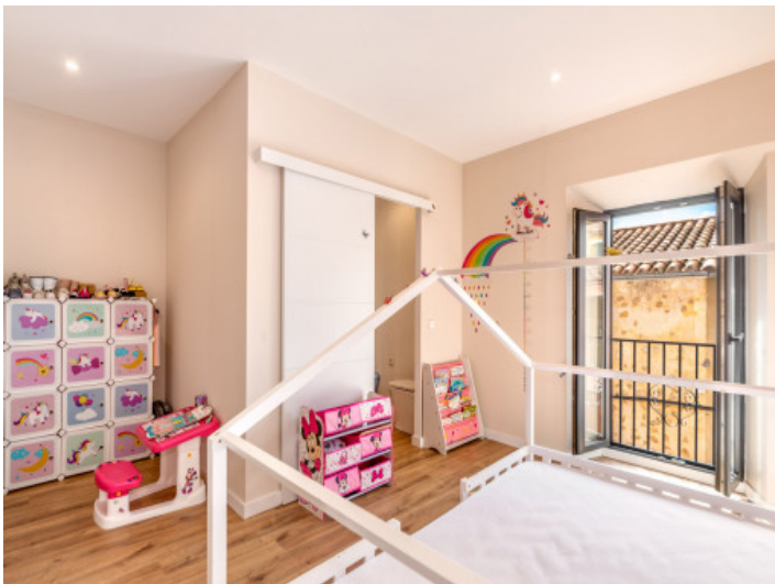
Eines von 2 Schlafzimmern