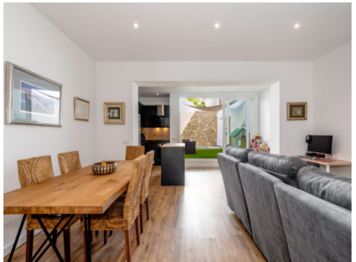
Heller und gemütlicher Wohn-/Essbereich