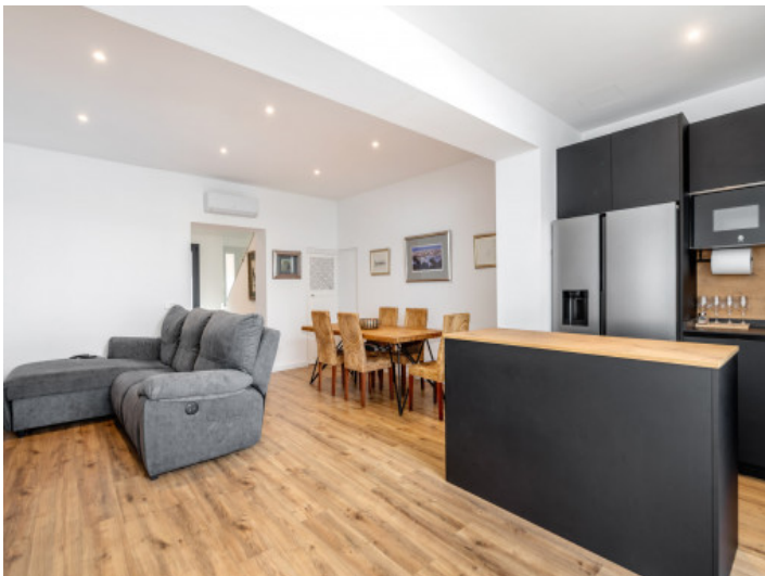
Offener Wohn-/Essbereich mit Küche