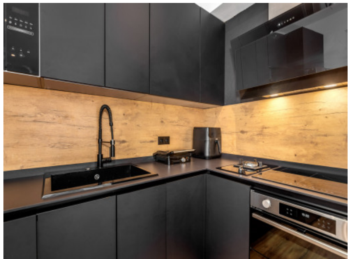
Moderne, komplett ausgestattete Küche

Alle Angaben nach bestem Wissen. Irrtum und Zwischenverkauf vorbehalten. Dieses Exposé ist eine Vorinformation, als Rechtsgrundlage gilt allein der notariell abgeschlossene Kaufvertrag.