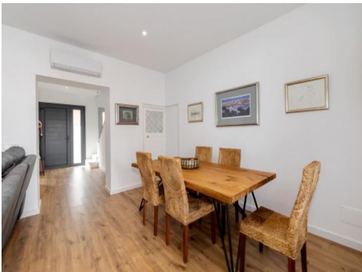
Elegant gestalteter Essbereich