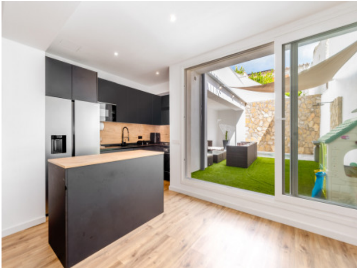
Küche mit Insel und Zugang zum Innenhof

PORTA MALLORQUINA® Your home. Our passion.