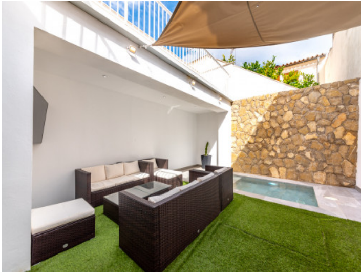
Innenhof mit Pool, Lounge und Privatsphäre