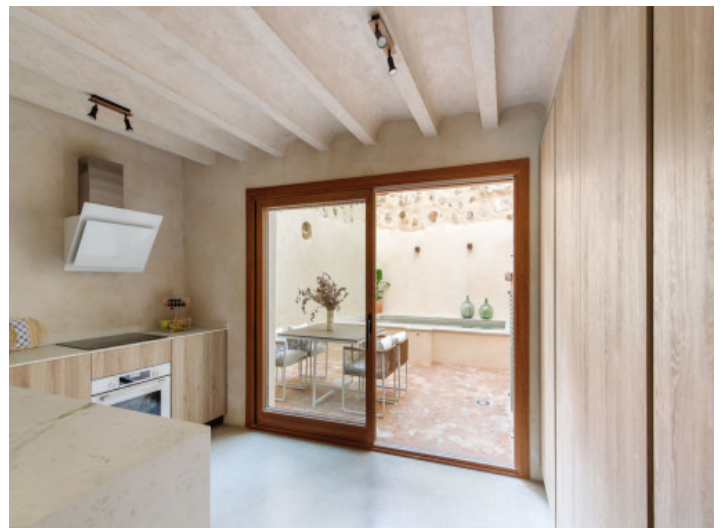
Küche mit direktem Terrassenzugang

Alle Angaben nach bestem Wissen. Irrtum und Zwischenverkauf vorbehalten. Dieses Exposé ist eine Vorinformation, als Rechtsgrundlage gilt allein der notariell abgeschlossene Kaufvertrag.