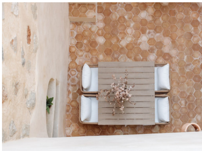
Ruhiger Bereich auf der Terrasse

Alle Angaben nach bestem Wissen. Irrtum und Zwischenverkauf vorbehalten. Dieses Exposé ist eine Vorinformation, als Rechtsgrundlage gilt allein der notariell abgeschlossene Kaufvertrag.